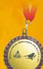
República Dominicana 2014